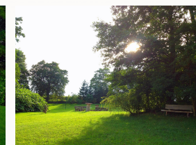
Blick vom See zur Ferienwohnung