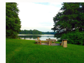
Blick zum See

Einfach abhängen. In der Sonne, im Schatten, auf dem See, am Strand.... Alles ist möglich. Platz ist reichlich vorhanden. Es liegt an Ihnen, den besten Nutzen aus den gegebenen Möglichkeiten zu ziehen.